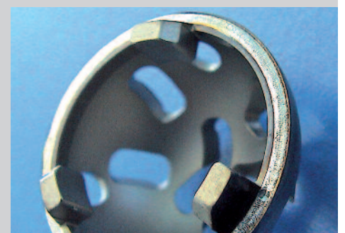
Hüftgelenkkapsel (Foto: Käppeli Schweißmechanik AG, Hünenberg)